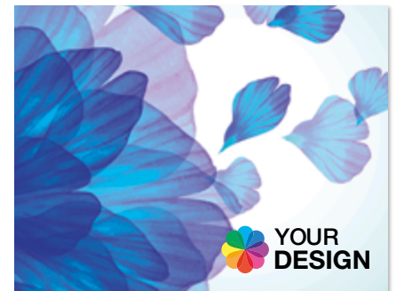
Ansicht des fertigen Microfasertuches

— = Druckfläche 44 x 34 cm inkl. 2 cm Beschnittzugabe