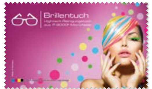
Ansicht des fertigen Brillentuchs