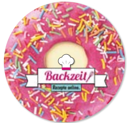
Ansicht des fertigen GripCleaner®

• Wir empfehlen diese Angabe aufgrund der Textilkennzeichnungsverordnung.