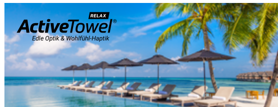
Ansicht des fertigen ActiveTowel® Relax